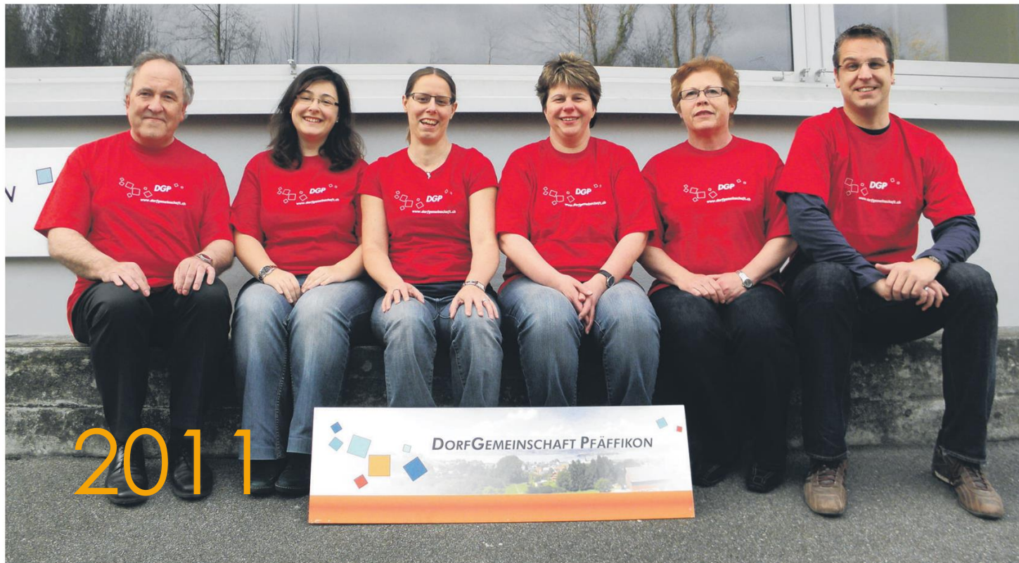
So präsentiert sich der Vorstand der Dorfgemeinschaft Pfäffikon.